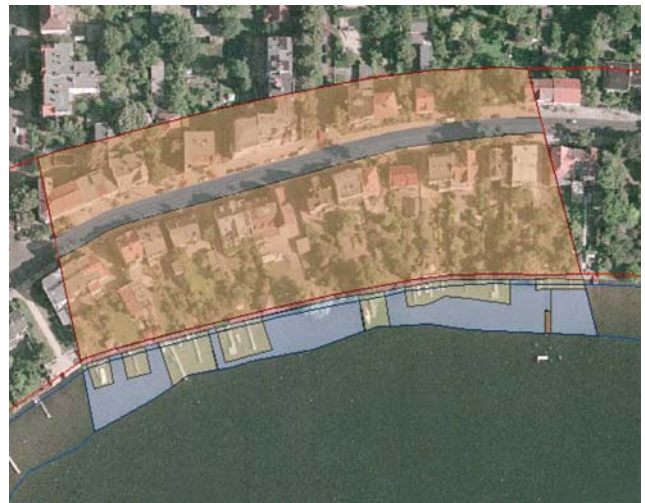
Abbildung 1: Abgrenzung der Subsegmente und Markierung einzelner Objekttypen (Beispiel Müggelsee, Berlin)

bildung auch Erfahrungen in der Luftbildinterpretation sowie möglichst gute lokale Geländekenntnisse mitbringen, um die Objekte sicher identifizieren zu können.